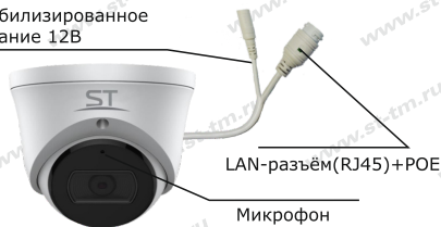
Рис.1 Схема подключения видеокмеры